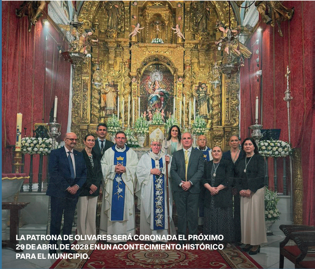
LA PATRONA DE OLIVARES SERÁ CORONADA EL PRÓXIMO 29 DE ABRIL DE 2028 EN UN ACONTECIMIENTO HISTÓRICO PARA EL MUNICIPIO.

La Coronación Canónica supondrá uno de los acontecimientos religiosos y sociales más importantes de la historia reciente de Olivares, reforzando la profunda devoción y el vínculo histórico del municipio con su Patrona.